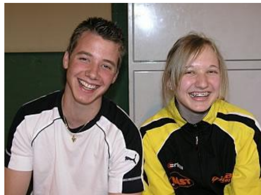
(sogar Fans aus Amlach waren anwesend)

Über 60 Teilnehmer aus ganz Tirol ( Reutte, Telfs, Seefeld, Innsbruck, Völs, Jenbach, Kitzbühel, St. Johann und Nußdorf/Debant ) pilgerten, teilweise schon am Vortag, nach Osttirol.